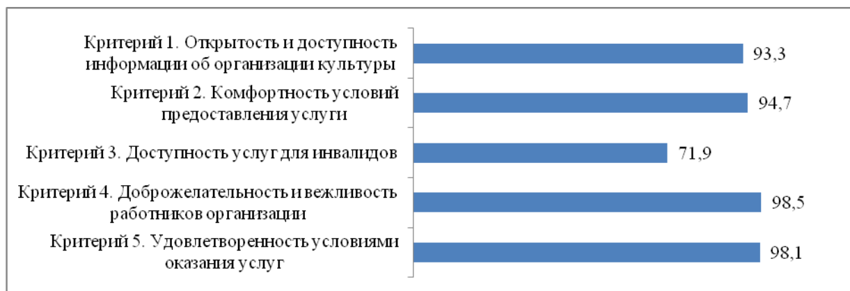
Рисунок 2. Итоговые значения показателей независимой оценки качества условий оказания услуг в МБУК «Шенкурский районный краеведческий музей», баллы

Итоговые значения показателей, характеризующих общие критерии оценки качества условий оказания услуг МБУБ «Шенкурский районный краеведческий музей», представлены на рисунке 2.